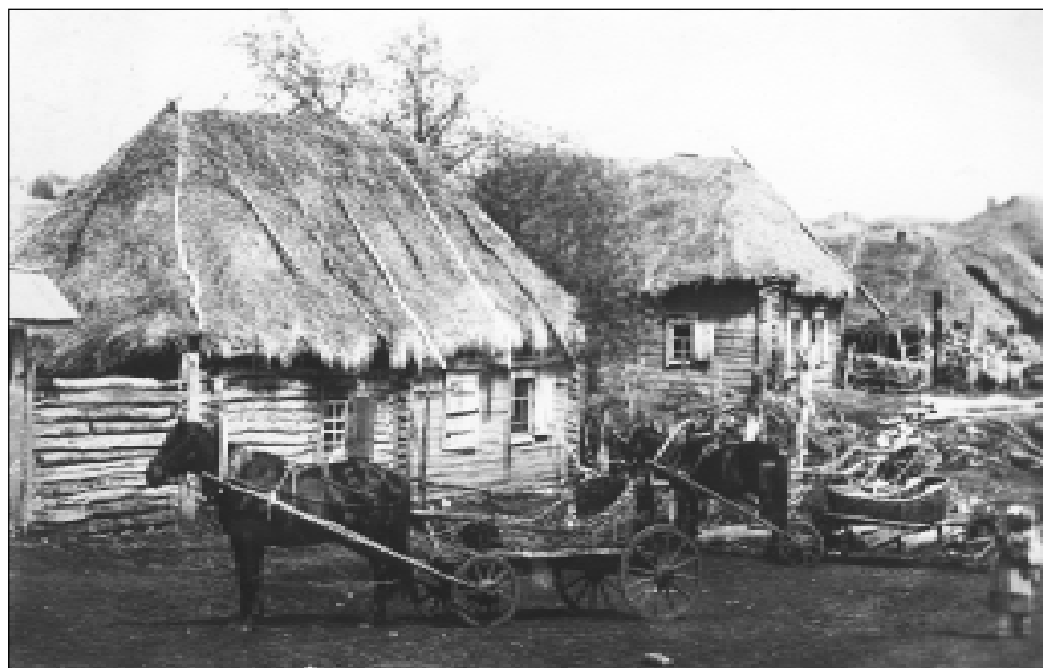
Улица села Бижбуляк. 1929 г.