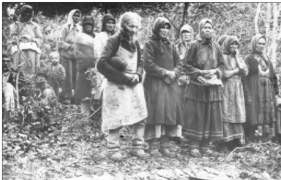
Полевое моление уй чук. Белебеевский кантон, с. Базлык.