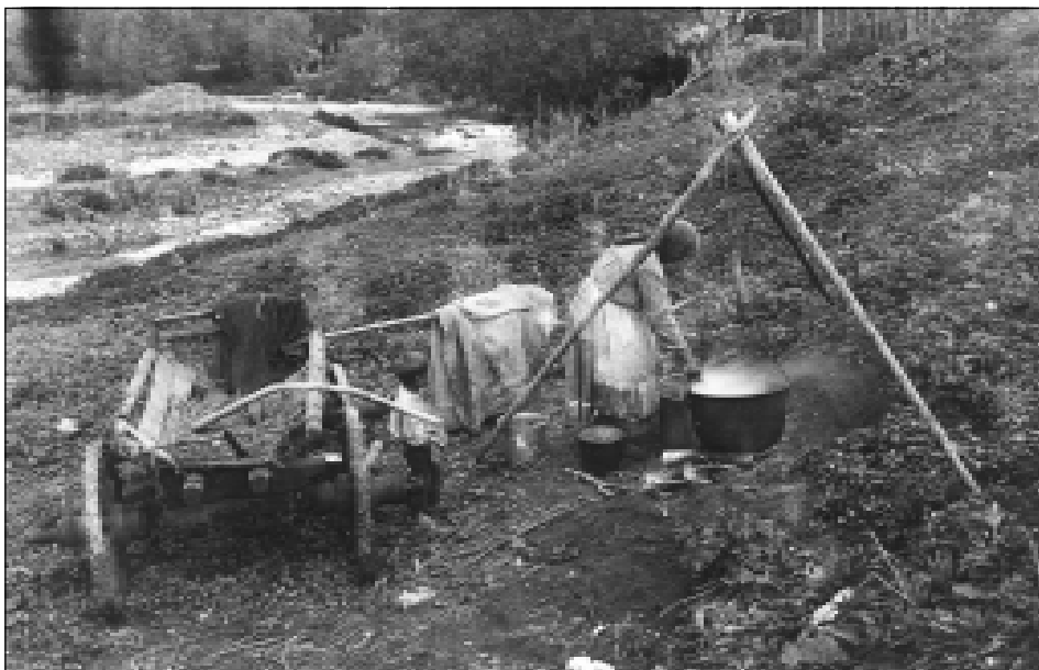
Приготовление пива у реки. Белебеевский кантон, с. Слакбаш. 1929 г.