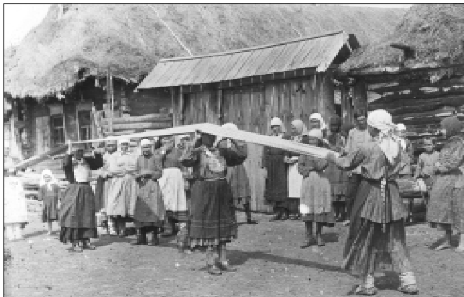
Женщины растягивают холст. Белебеевский кантон, д. Кистенли-Богданово.