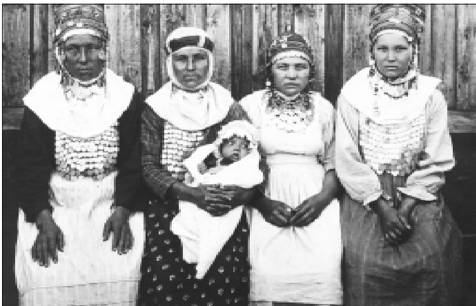
Женщины в национальных одеяниях. Белебеевский кантон, с. Слакбаш. 1929 г.