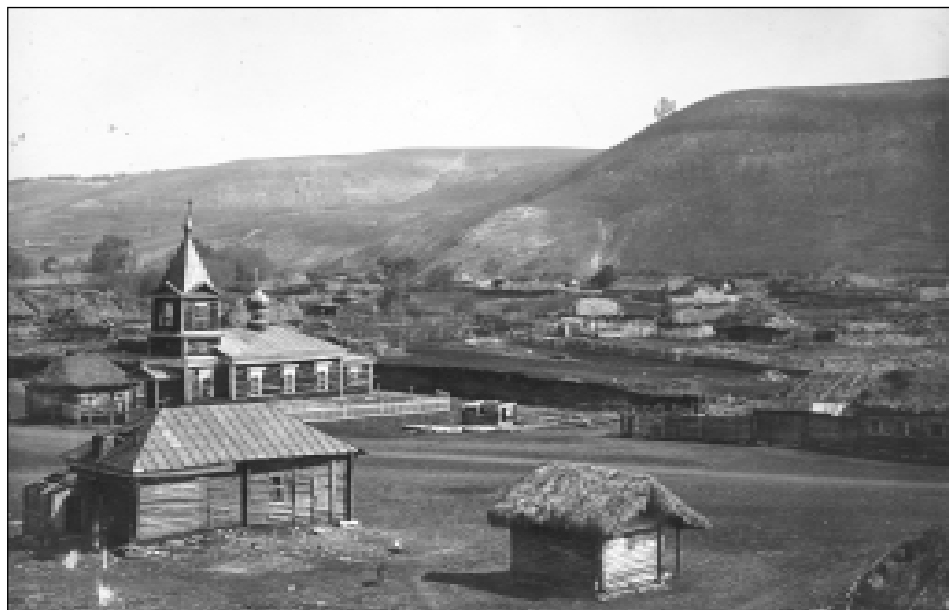
Общий вид села Кош-Елга. 1929 г.